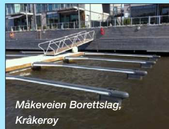
Måkeveien Borettslag, Kråkerøy